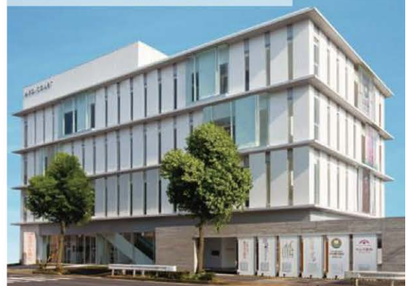
医療モール（名古屋市南区）